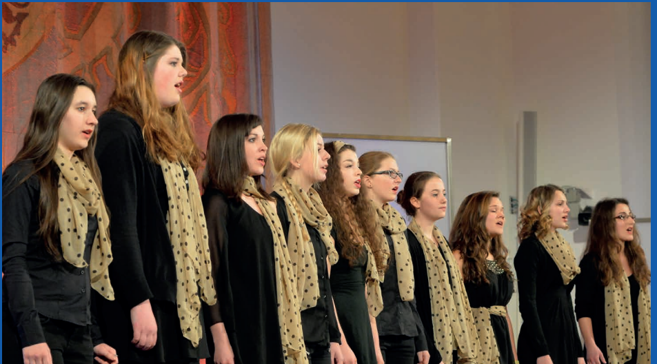
Das Vokalensemble „Stimmband“ begleitete den Abend musikalisch.