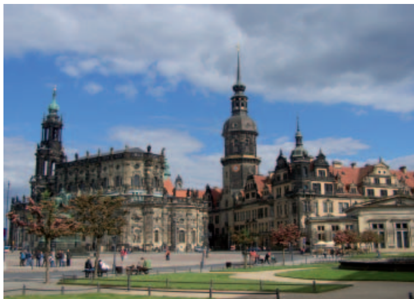
Dresdens Schokoladenseite mit Hofkirche (links) und Hausmannsturm

Seit 2009 ist er Landtagspräsident. Er sieht im Potenzial der Rechtsextremen eine Mischung aus Protestwählern und sozial Benachteiligten („Das Abgehängtwerden führt im Osten zur Radikalisierung“). Die früher getrennten Gruppierungen seien mittlerweile eng zusammengeschweißt – das mache ihre Stärke aus. Im Parlament seien die Rechten allerdings „ziemlich trübe Tassen“. Mit denen müsse man die