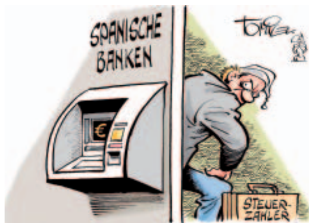
„Europäischer Geldautomat“ Zeichnung: Tomicek