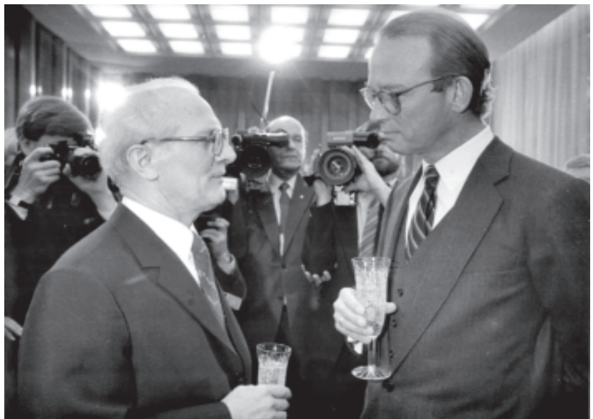
Hans-Otto Bräutigam (rechts) mit dem DDR-Staatsratsvorsitzenden Erich Honecker beim Neujahrsempfang 1984

Bräutigam war damals in großer Sorge darüber, dass die DDR-Behörden die Vertretung abriegeln würden. Um einem Massenansturm auf die Vertretung vorzubeugen, der nicht zu bewältigen gewesen wäre, schloss Bräutigam die Einrichtung für den Besuchsverkehr. Nur eine telefonische Beratung wurde aufrechterhalten. Nach langen Verhandlungen, an denen wiederum Vogel aktiv beteiligt war, konnten die Menschen im Juli 1984 in die Bundesrepublik übersiedeln. Doch zuvor mussten sie – so die Forderung der SED-Führung – wieder zu ihrem Wohnort zurückkehren und dort einen regulären Ausreiseantrag bei den Behörden stellen. Bräutigam bezeichnet es als eine seiner schwierigsten Aufgaben, bei den Flüchtlingen Vertrauen in seine Versi-