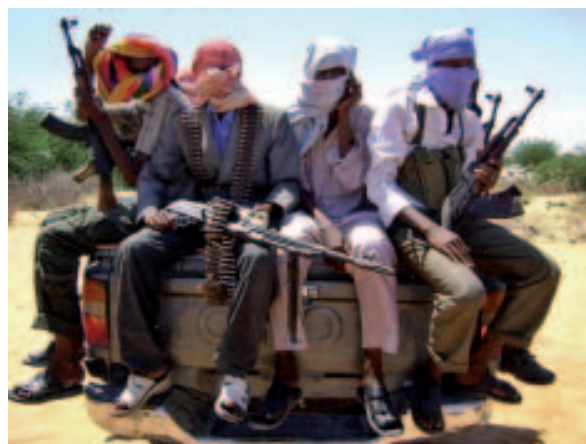
Bewaffnete Rebellen im Bürgerkrieg in Somalia

Durch die breite Beteiligung afrikanischer Staaten (insgesamt neun) wird der zweite Krieg oft als „Afrikanischer Weltkrieg“ bezeichnet. Der Kongo und Ruanda könnten aber als Hauptakteure ausgemacht werden, sagte Vorrath. 2007 kam es zu einer gemeinsamen Sicherheitsstrategie von Ruanda, Burundi, dem Kongo und Uganda. Aktuell hätte sich die Lage entspannt. Trotzdem: Mit einem letzten Platz beim Human Development Index (HDI) und