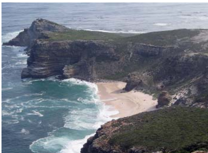
Das Kap der Guten Hoffnung – die Südspitze Afrikas