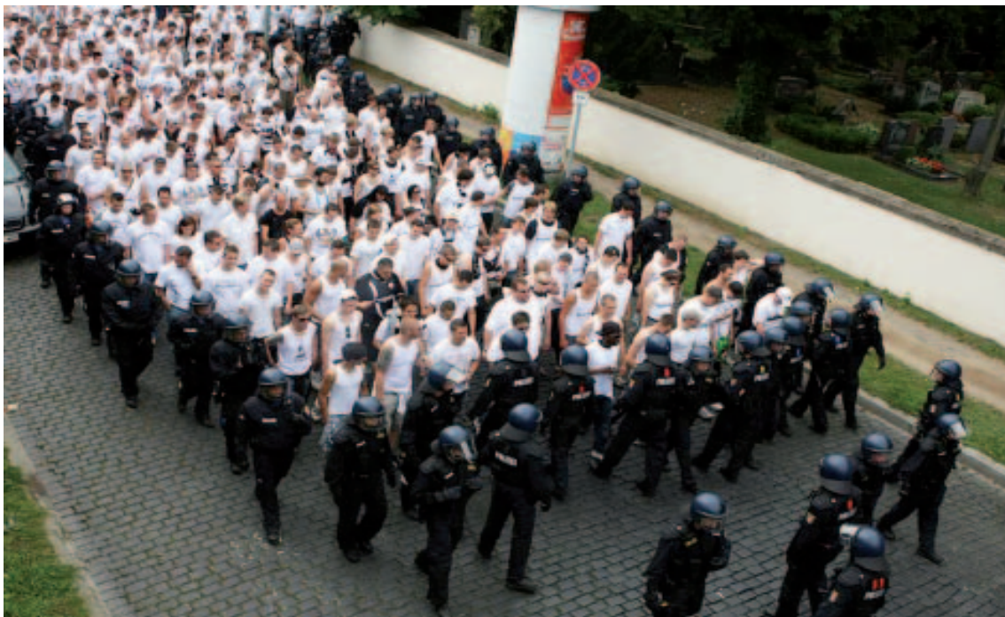
Hooligans des Fußballvereins Eintracht Frankfurt werden auf dem Weg zum Lokalderby gegen Offenbach von Polizisten begleitet