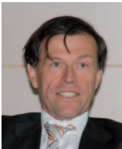
Matthias Rößler: „Das Abgehängtwerden führt im Osten zur Radikalisierung“

Rößler ist seit 1990 Mitglied des Sächsischen Landtags und war von 1994 bis 2004 zunächst Kultus- und später Wissenschafts- und Kunstminister in Sachsen.