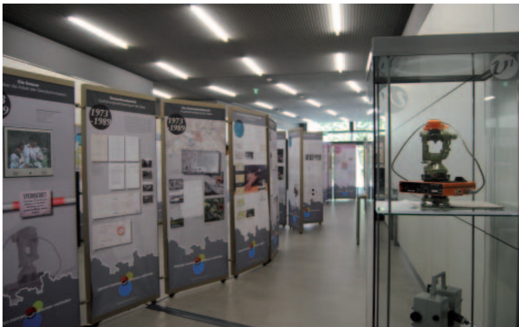
Im Rahmen der Tagung wurde die Ausstellung „Grenzen trennen – Grenzen verbinden. 20 Jahre Wiedervereinigung“ gezeigt