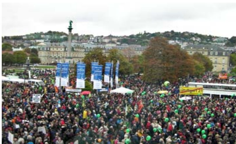
Massenproteste gegen Stuttgart 21