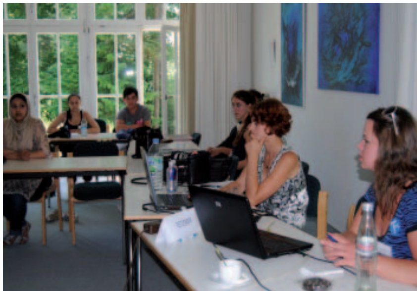
Redaktionskonferenz bei Tutzing FM: Studierende des Studiengangs Online-Journalismus aus Darmstadt

Die Nutzer sind zwischen 20 und 45. Sie kommen vorwiegend aus einem akademischen Umfeld in Groß- und Universitätsstädten und hören ein journalistisch hochwertiges Programm mit Popmusik. Was fehlt, sind Nachrichten. Dafür gibt es Hintergrundberichte. 4000 Hörer pro Tag zählt detektor.fm, die durchschnittlich 29 Minuten am Programm dran bleiben. Medienforscher wissen: Das ist sehr viel. Geld verdienen die Leipziger Hörfunker mit Sponsorenwerbung für einzelne Sendungen. Dafür sucht man