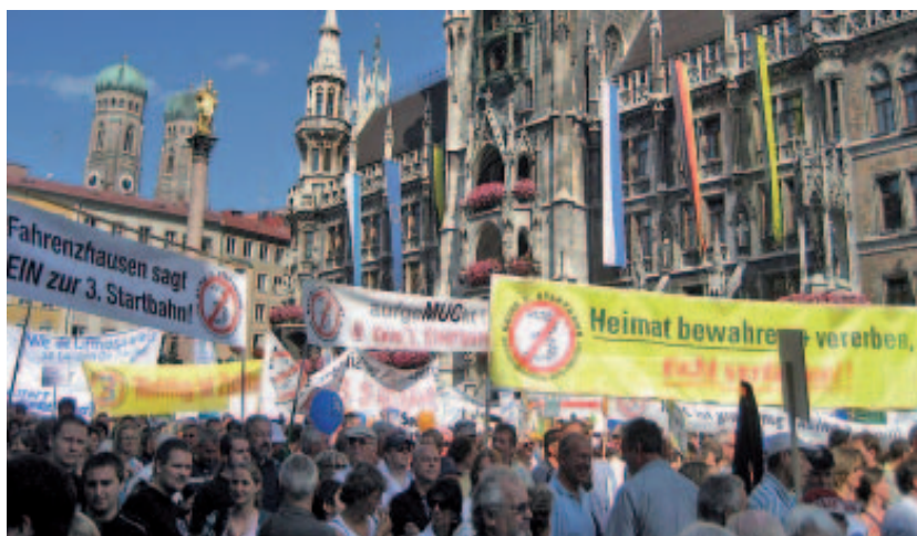
Großdemonstration gegen den Bau der dritten Startbahn am Flughafen München auf dem Marienplatz vor dem Rathaus

Hans-Jürgen Papier, der frühere Präsident des Bundesverfassungsgerichts, brachte eine notwendige Differenzierung in die Debatte ein: die Betroffenenbeteiligung und die direkte Demokratie. Die Beteiligung unmittelbar Betroffener bei Großprojekten sei gesetzlich vorgeschrieben, die generelle direkt-demokratische Beteiligung der Bürger hingegen sei eine grundsätzlich andere Frage. Papier plädierte für