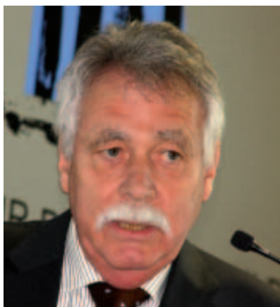
Wolfgang Wiegard rät Deutschland: Inlandsinvestitionen stärken

Wolfgang Wiegard – von 2001 bis 2011 einer der fünf Wirtschaftsweisen – prognostizierte, dass sich die deutsche Konjunktur 2012 vorüber-