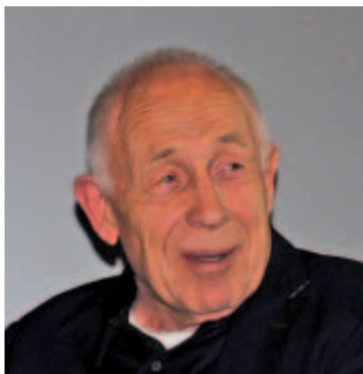
Heiner Geißler forderte eine intensive Einbindung der Bürger bei Großprojekten

Nach Meinung Geißlers herrsche derzeit ein Misstrauen gegenüber dem ökonomischen System, das sich auf die Politik übertrage. „Die Bürger lassen sich nicht mehr alles gefallen,