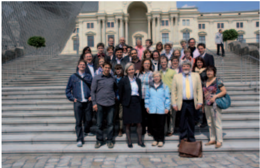
Die Mitarbeiterinnen und Mitarbeiter der Akademie vor dem Militärhistorischen Museum in Dresden