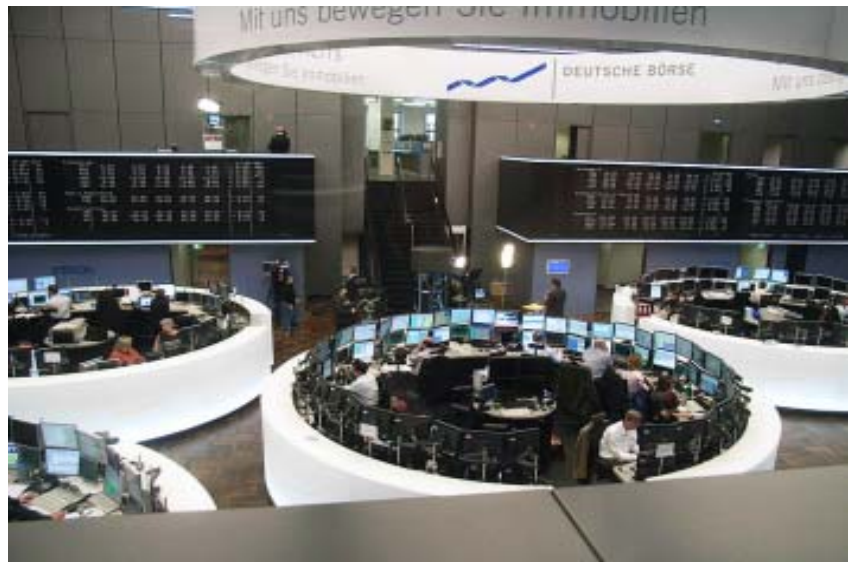
Ein Schauplatz der europäischen Schuldenkrise: die Frankfurter Börse

in Deutschland sei die Zahl der Importe gering und führe zu Leistungsbilanzungleichgewichten in der Europäischen Währungsunion (EWU). Um die Probleme langfristig lösen zu können, plädierte Herr für eine stärkere Integration der EWU, eine abgestimmte Lohnentwicklung, Mechanismen zum Abbau der Leistungsbilanzungleichgewichte und weitergehende fiskalische Koordinationen.