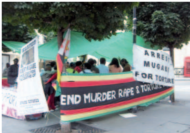
Gegner des Mugabe-Regimes demonstrieren 2006 vor der Botschaft Simbawwes in London

Ist Südafrika nun ein Schwellen- oder Entwicklungsland? Die schwarze Mehrheitsbevölkerung, die Buren und internationale Finanzinteressen beeinflussen die Geschicke Südafrikas nachhaltig. Dieses Trio kann sich zu einem goldenen Dreieck zusammenfügen, erklärte Pabst. Bei gegenläufigen Interessen sollte diese Konstellation jedoch für Sprengstoff.