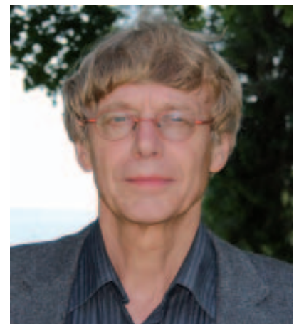
Dieter Rucht: „Auch privilegierte und staatsnahe Gruppen neigen vermehrt zu Protesten“

Erleben wir eine neue Dimension des Protests? Dieter Rucht vom Wissenschaftszentrum Berlin für Sozialforschung erklärte hierzu: „Proteste sind fester Bestandteil politischer Kultur und verändern sich nur langsam.“ Es gäbe kaum neue Grundformen des