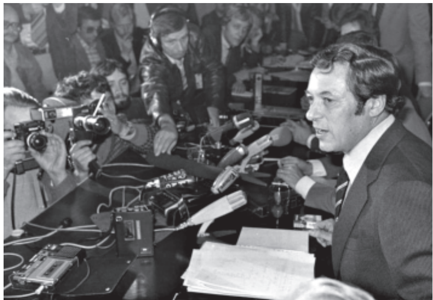
Regierungssprecher Klaus Bölling verliest am 18. Oktober 1977 um 2 Uhr nachts im Presse- und Informationsamt der Bundesregierung in Bonn eine gemeinsame Erklärung des großen Krisenstabes nach der geglückten Befreiung von Geiseln aus einem von Terroristen gekaperten Lufthansa-Flugzeug auf dem Flughafen Mogadischu (Somalia)

Als Bezeichnung für das Informationsverhalten der Bundesregierung während der Schleyer-Entführung hatte sich das Stichwort „Nachrichtensperre“ eingebürgert. Nachrichtensperre lautete denn auch das Titelthema des Ersten Tutzinger Mediengesprächs, zum dem der erst kürzlich ver-