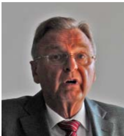
Hans-Jürgen Papier: Skepsis gegenüber Volksabstimmungen

Alle Staatsgewalt geht vom Volke aus. Sie wird vom Volke in Wahlen und Abstimmungen und durch besondere Organe der Gesetzgebung, der vollziehenden Gewalt und der Rechtsprechung ausgeübt. So steht es im Artikel 20 des