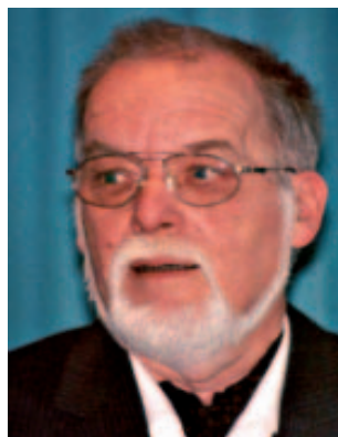
Gebhard Diemer 1935 – 2012

„Der Diemer“ war ein philosophischer und historischer Kopf. Und er war ein leidenschaftlicher und glänzender Vermittler, der seine Zuhörer zu packen und zu begeistern verstand, ihnen Orientierung anbot, ohne je der unschicklichen Absicht zu verfallen, ihnen etwas aufzudrängen.